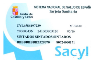
Fotocopia de la tarjeta sanitaria